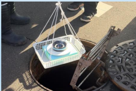
Sスマートボールの活用状況