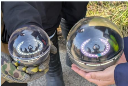
球体調査装置「スマートボール」