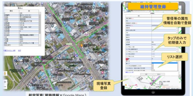
クラウド型管路台帳システムBlitz GIS